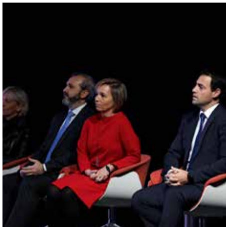
2019_ BEC Bilbao Exhibition Centre