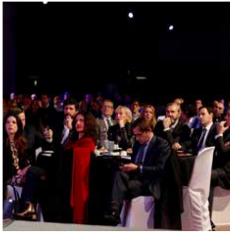
2019_ BEC Bilbao Exhibition Centre