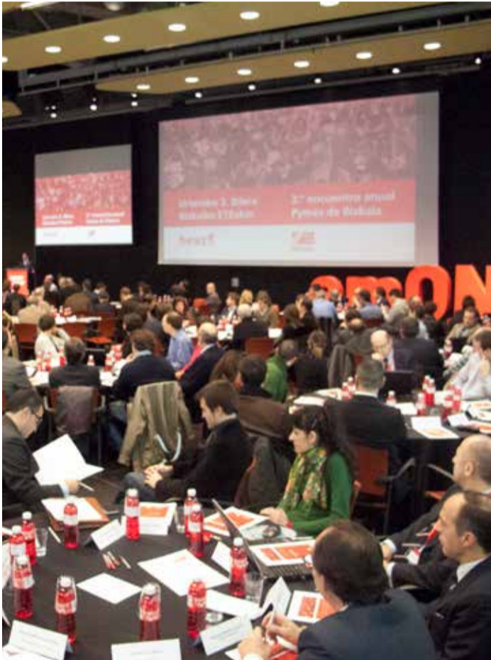
2014_ETB. Gela Multibox / ETB. Sala Multibox