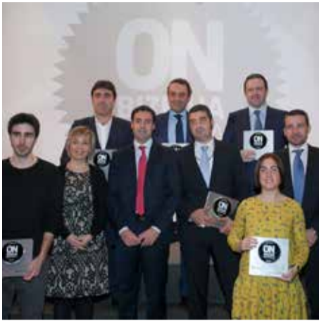
2016_ BEC Bilbao Exhibition Centre