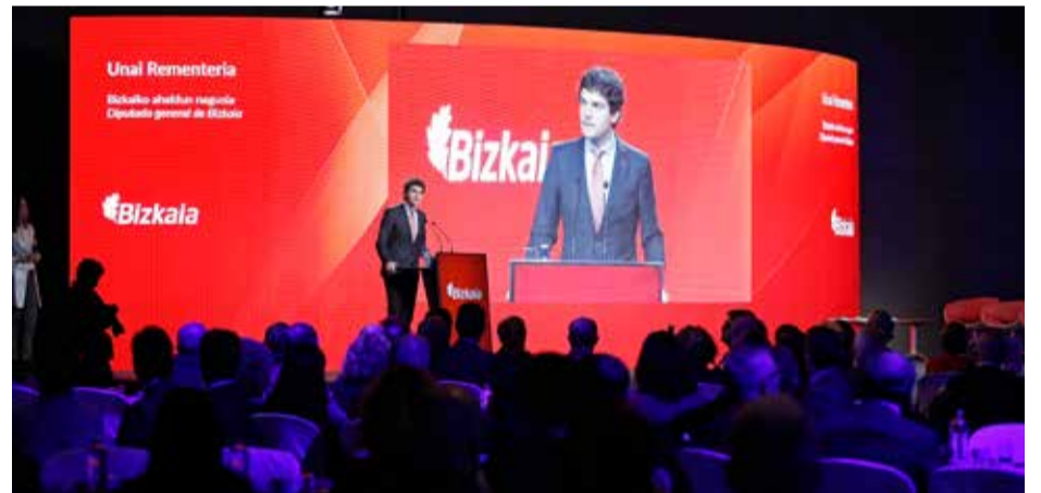
2018_ BEC Bilbao Exhibition Centre

enpresak saritzea eta gai interesgarri bati buruz elkarrekin hausnartzea. Gauza batzuei eustea gure esku dago: topaketa bera, haren sekuentzia, iraupena... Beste batzuk, eta hamargarren edizio hau horren erakusgarri argia da, aurreikusi ezinak dira. Garrantzitsuena, ordea, bizitzea tokatzen zaigun garaitik kanpo dago, eta hori da elkartzeko gonbidapen honek izango duen erantzuna. Atzera begiratzean zirrara eragiten duen zerbait badago, hori da duela hamar urtetik, urtero, 500 pertsonak erabakitzen dutela hitzordu hau beren agendan lehenestea. Tamainako erantzunaren aurrean, harridura, gogobetetasuna eta errespetua sortzen da, langa oso goi baitago. Baina, batez ere, miretsita gaudela idatzi gabe dagoen Bizkaiarekiko konpromiso sendoa ikusirik. Bizkaia Egiten!