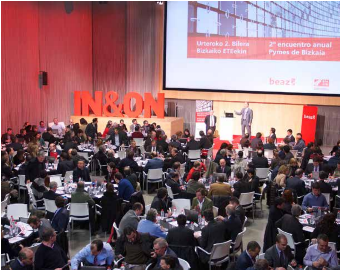
2013_ETB. Gela Multibox / ETB. Sala Multibox