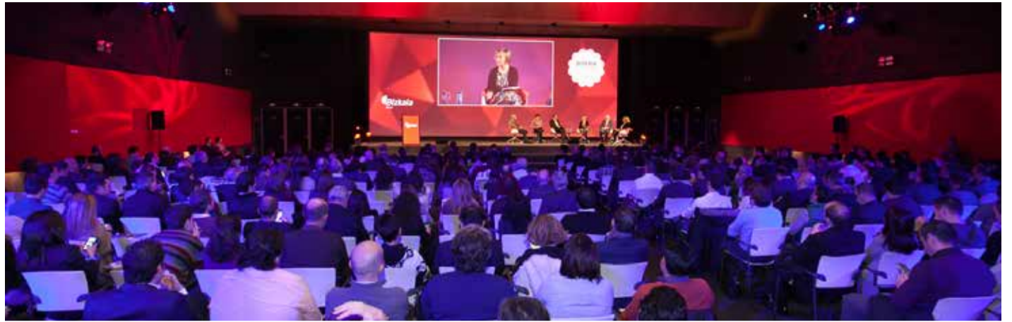
2016_ BEC Bilbao Exhibition Centre