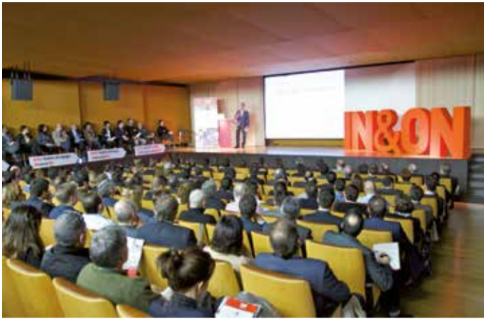
2012_Arte Ederren Museoa / Museo de Bellas Artes