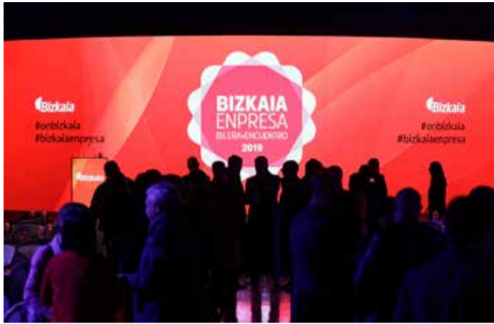
2019_ BEC Bilbao Exhibition Centre