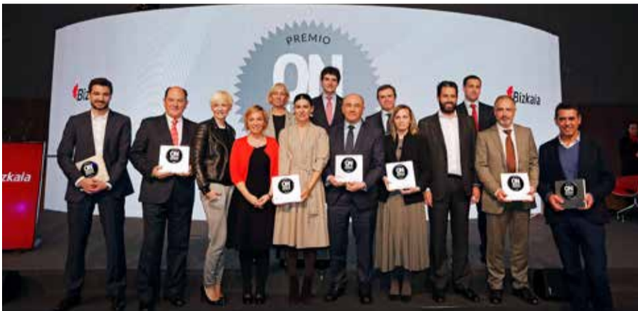
2018_ BEC Bilbao Exhibition Centre