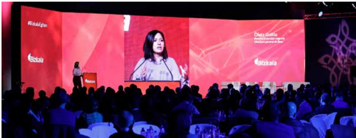
2020_ BEC Bilbao Exhibition Centre