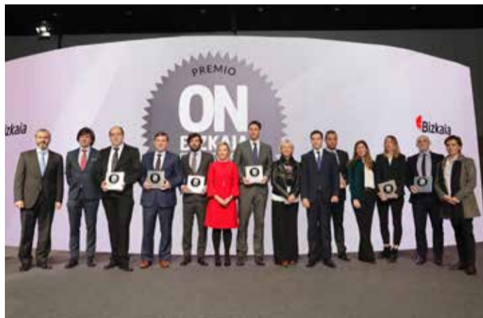
2019_ BEC Bilbao Exhibition Centre