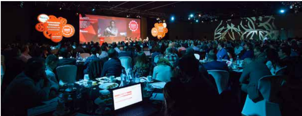
2017_ BEC Bilbao Exhibition Centre