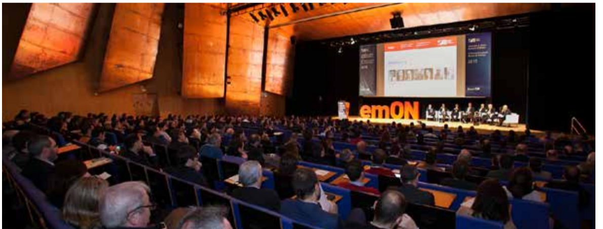
2015_Euskalduna Jauregia / Palacio Euskalduna

B izkaia Enpresa hamargarren urteurrenara aldaketarako gogoarekin iritsi da, baina bere muinari utsiz. Beazek 2011n sortu zuen, Bizkaiko Foru Aldundiaren eta lurraldeko enpresa eta ekintzaileen arteko lotura sendotzeko asmoz. Ideia hori oraindik ere funtsezkoa da urtero elkartzeko nahia ulertzeko. Aurrez aurre, birtualki edo bi formatuetan, oraingo honetan gertatuko den bezala.