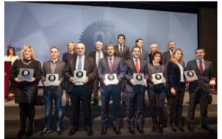
2017_ BEC Bilbao Exhibition Centre